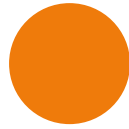
181 neon orange