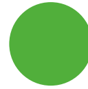
401 neon green