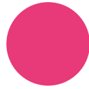
241 neon pink